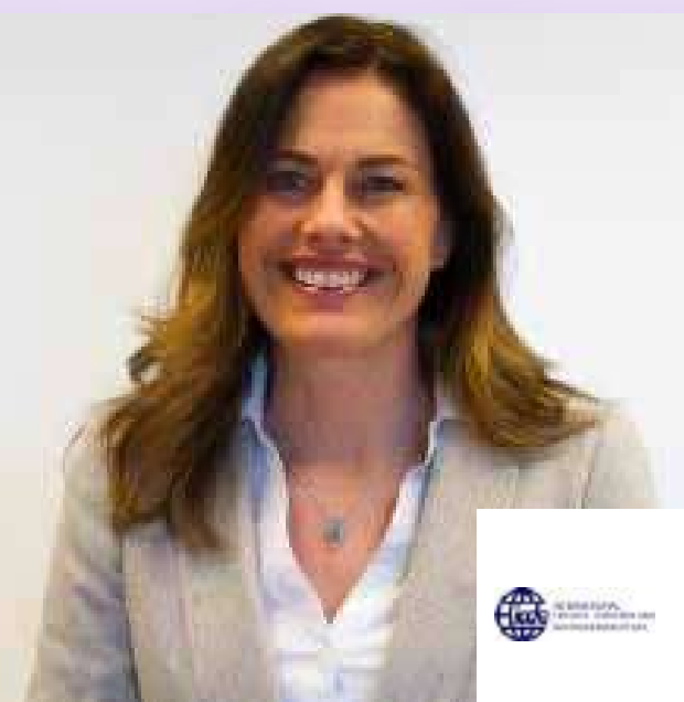
تورون جيلسفيك الأمينة العامة للمجلس الدولي للتعليم المفتوح والتعليم عن بعد