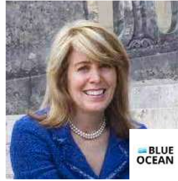
د. رينيه موبورن أستاذة ومؤسسة استراتيجية المحيط الأزرق