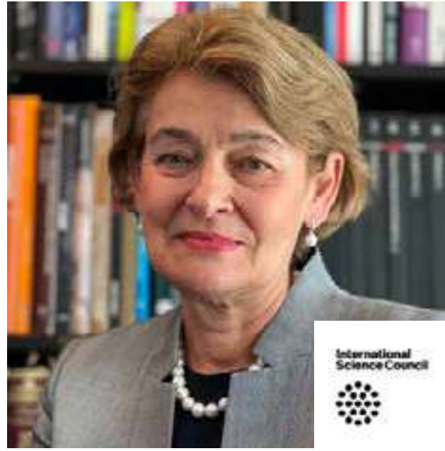
إيرينا بوكوفا الراعية للمجلس الدولي للعلوم