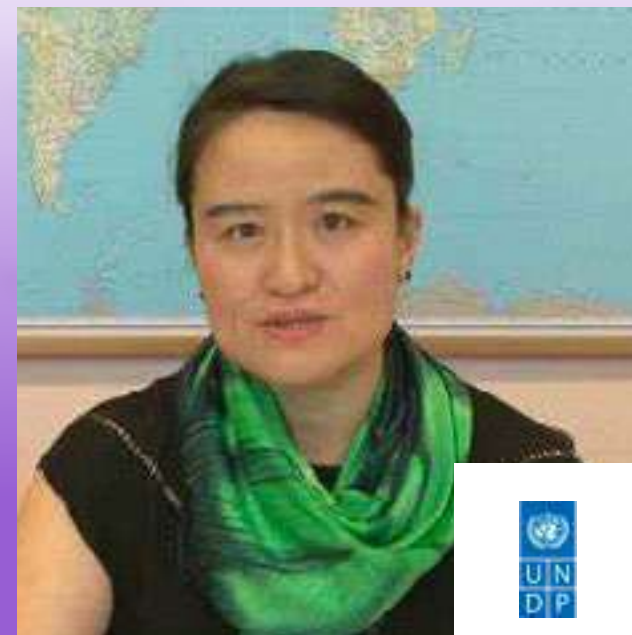
ينتشان تشانغ كبير الاحصائيين، برنامج الأمم المتحدة الإنمائي