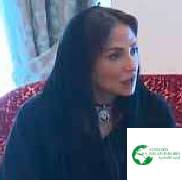
صاحبة السمو الملكي الأميرة لمياء بنت ماجد آل سعود

المندوبة الدائمة للمملكة العربية السعودية لدى اليونسكو