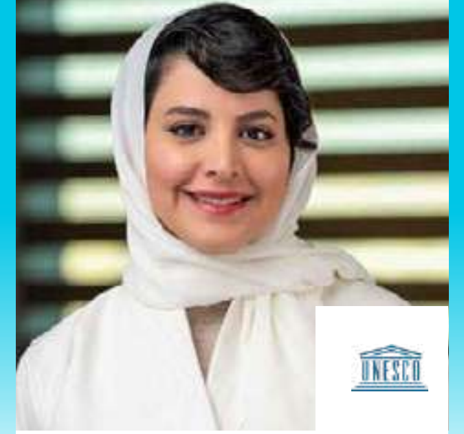
سمو الأميرة هيفاء آل مقرن

ممثل المنظمة الدولية للفرانكوفونية في الشرق الأوسط