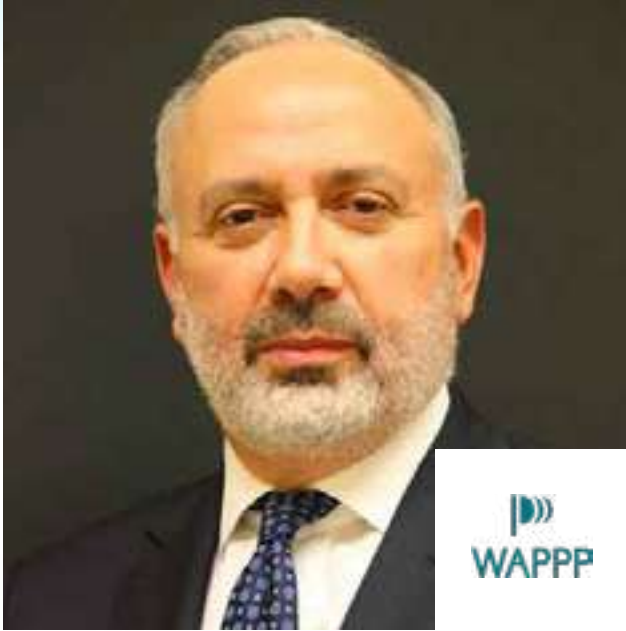
زياد- أليكساندر هايك رئيس الجمعية العالمية للشراكة بين القطاعات العام والخاص