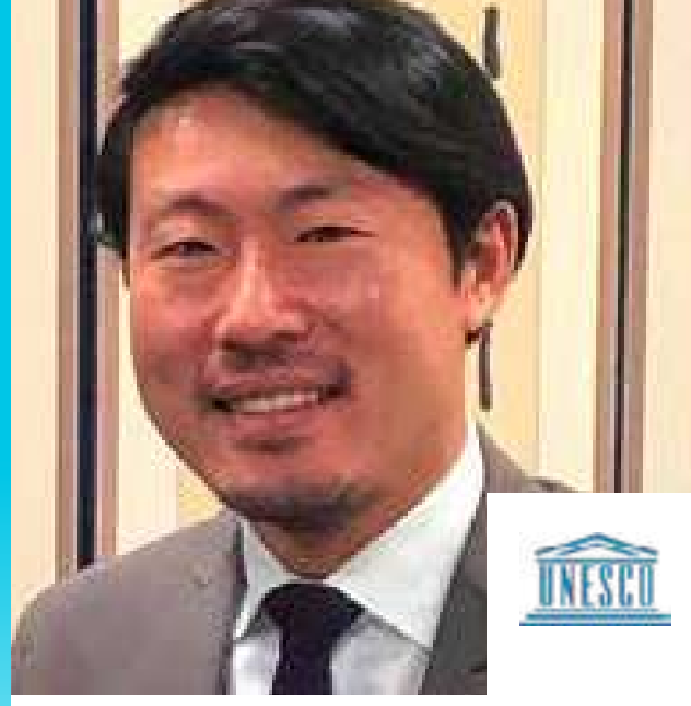
كي لينغ منسق البرنامج، السياسات الثقافية والتنمية، اليونسكو