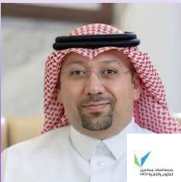
معالي د. منير الدسوقي رئيس مدينة الملك عبدالعزيز للعلوم والتقنية