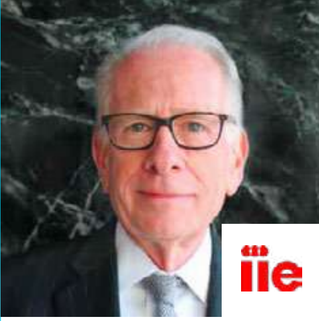
د. آلان جودمان الرئيس التنفيذي للمعهد الدولي للتعليم