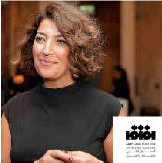
ريما مسمار المديرة التنفيذية للصندوق العربي للثقافة والفنون (أفاق)