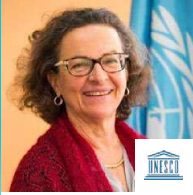
كوستانزا فارينا مدير المكتب الإقليمي في بيروت وممثل اليونسكو في لبنان وسوريا