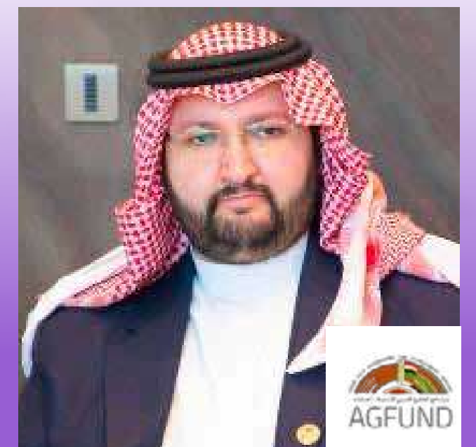
صاحب السمو الملكي الأمير عبد العزيز بن طلال بن عبد العزيز آل سعود رئيس مجلس إدارة برنامج الخليج العربي للتنمية (أجفند)