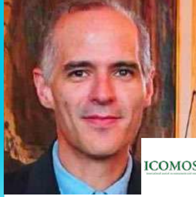
ماريو كوينتانو سانتانا الأمين العام للمجلس الدولي للمعالم والمواقع