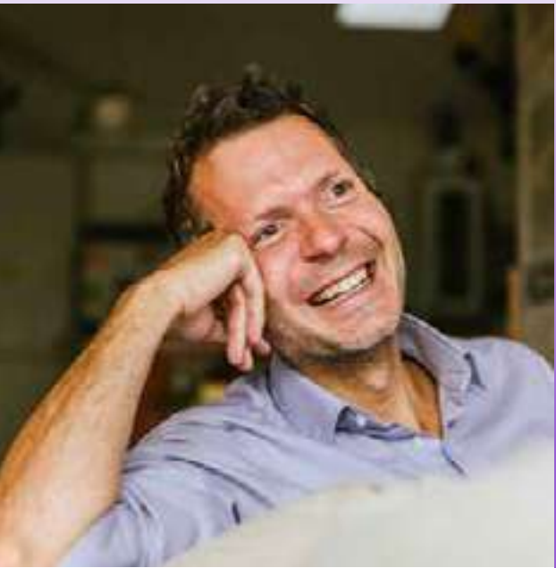
فريدريك لالو مفكر ومؤلف