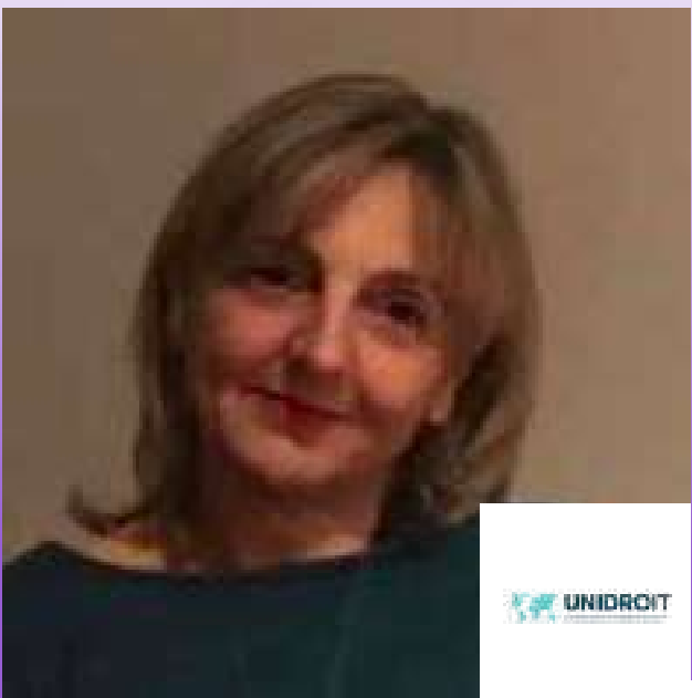
د. ماريا كيارا مالاجوتي رئيس المعهد الدولي لتوحيد القانون الخاص