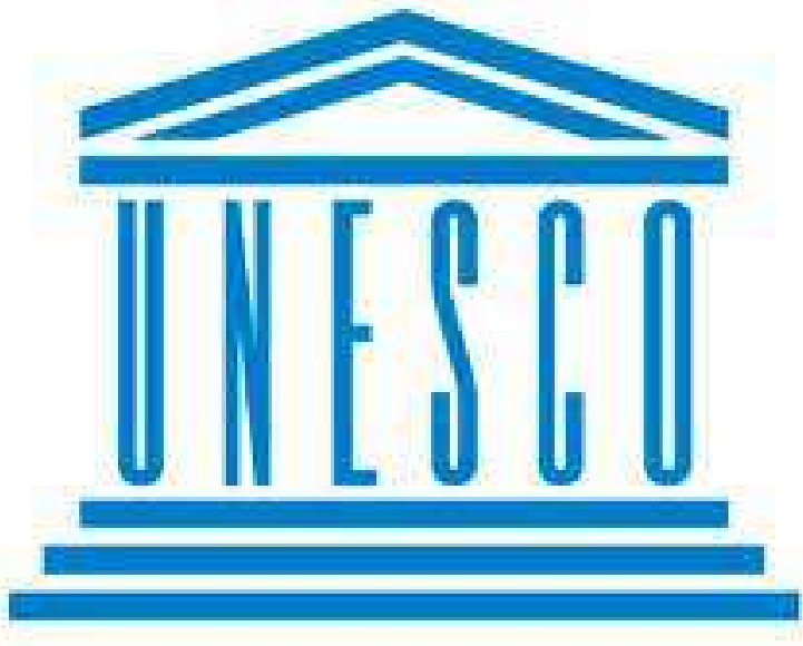
منظمة الأمم المتحدة للتربية والعلم والثقافة (اليونسكو)

خلال مؤتمر مستقبل منظمات التربية والثقافة والعلوم، اجتمعت للمرة الأولى منذ تأسيسها قبل أكثر من 50 عاماً المنظمات الدولية المعنية بمجالات التربية والثقافة والعلوم: