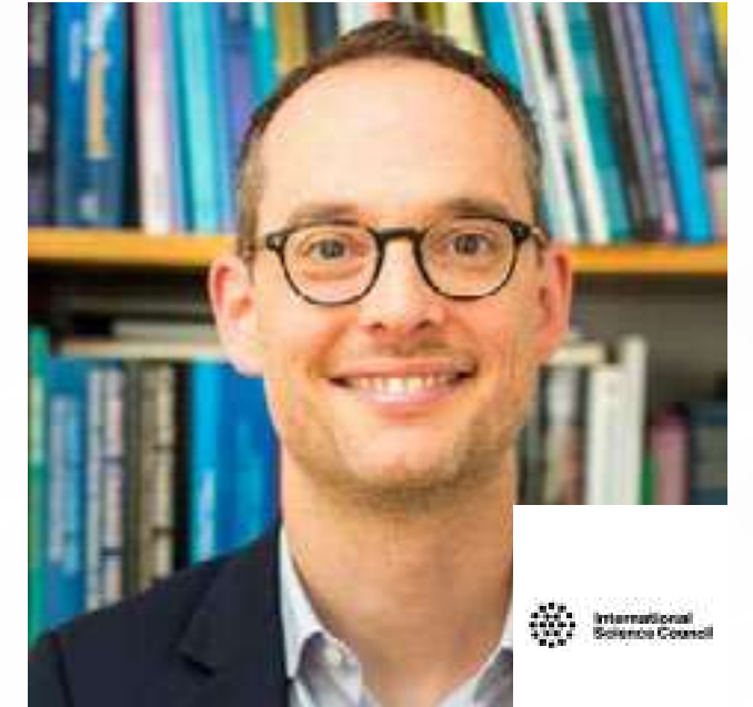
د. ماتيو دوني مدير أول ورئيس مركز مستقبل العلوم في المجلس الدولي للعلوم